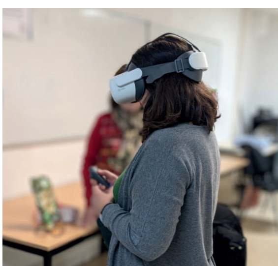
ADMR : des professionnels formés grâce à la réalité virtuelle pour accompagner au mieux les bénéficiaires