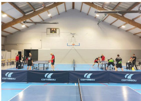
Match de championnat pour l'ESO Tennis de table