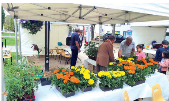
Fête des Parents proposée par l'Association Familiale d'Ormes (AFO)