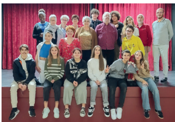
La Troupe du Cerf-Volant (Théâtre)