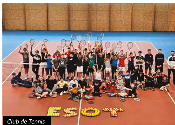
Club de Tennis