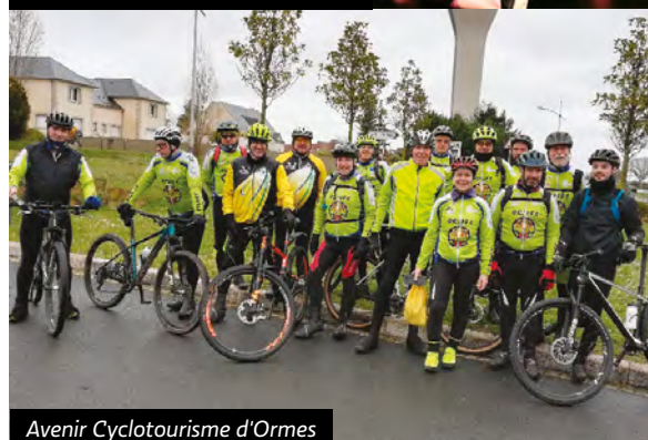
Avenir Cyclotourisme d'Ormes