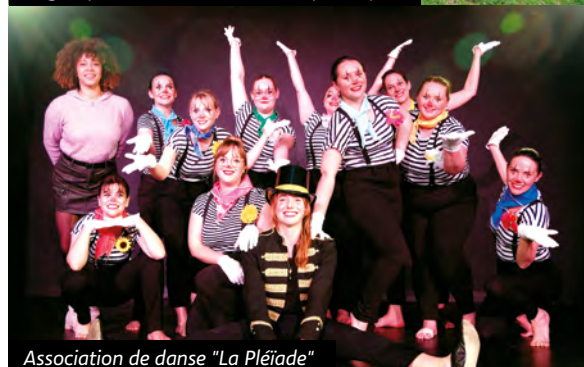
Association de danse "La Pléiade"