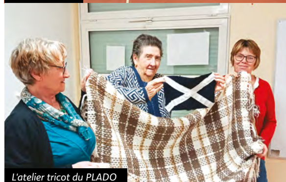
L'atelier tricot du PLADO