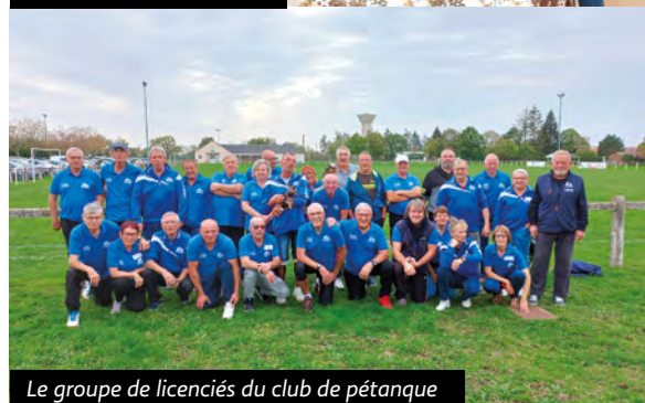
Le groupe de licenciés du club de pétanque